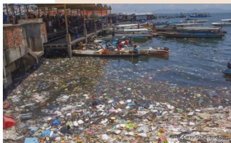
これらのゴミが海に沈む

ニューヨーク大学は世界中で集めた100銘柄以上のペットボトル水を調べたら全銘柄からマイクロプラスチックが見つかったとBBC放送は報じていました。スーパーの食品のトレーやラップ、キャンディの包み紙も煙草のフィルターも、残さず完全に焼却しないとみんな海底のマイクロプラスチックになります。安くて便利とプラスチックを多用するのを止め、紙袋と古新聞と竹の皮に戻らざるを得ない時代は遠くないでしょう。そうしないと私達自身が危なくなります。