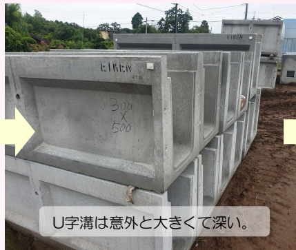
U字溝は意外と大きくて深い。