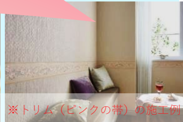
※トリム (ピンクの帯) の施工例